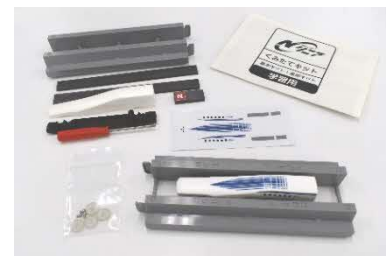
超電導リニアの模型 ※写真はキット2つ分です

「リニア・鉄道館」のホームページでもご案内しています。 (https://museum.jr-central.co.jp/)