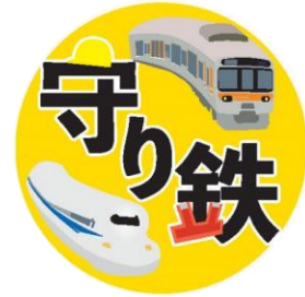
イベントロゴ（守り鉄）