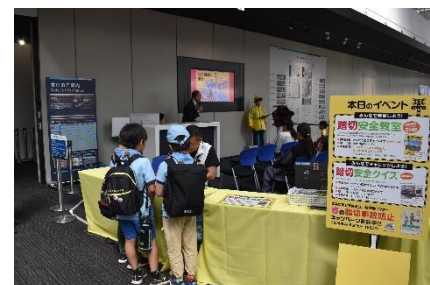
過去の同イベントの様子