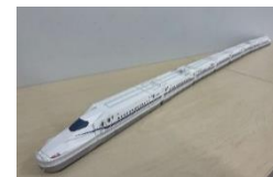
N700Sペーパークラフト 〔伸びる!〕タイプ