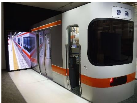
在来線シミュレータ「車掌」

在来線シミュレータ「車掌」を用いた車掌体験教室です。社員によるドア扱い、放送等の操作を見学した後、社員が先生となりながら、お子様にシミュレータを扱っていただきます。