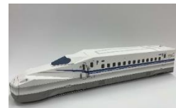
N700Sペーパークラフト 〔動く!〕タイプ