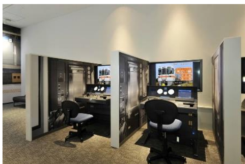
在来線シミュレータ「運転」

在来線シミュレータ「運転」を用いた運転体験教室です。社員による運転操作を見学した後、社員が先生となりながら、お子様にシミュレータを運転していただきます。