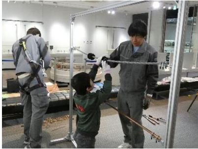
過去の同イベントの様子

※メンテナンス体験の他に電気設備のメンテナンスで使用する道具等に触れるコーナーを設置する予定です。当コーナーは自由に皆様にご参加いただけるため、空き時間等にぜひお立ち寄りください。