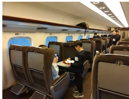
過去の同イベントの様子

※イベントは予告なく内容を変更、中止することがあります。 ※画像は全てイメージです。