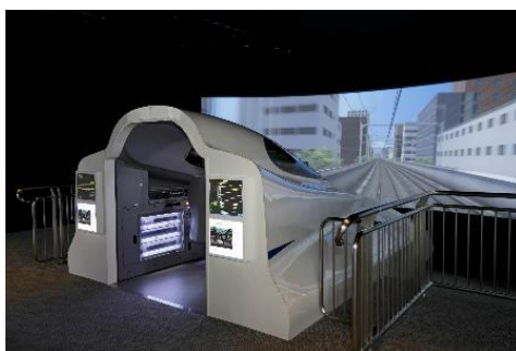
新幹線シミュレータ「N700」

新幹線シミュレータ「N700」を用いた運転体験教室です。社員による運転操作を見学した後、社員が先生となりながら、お子様にシミュレータを運転していただきます。