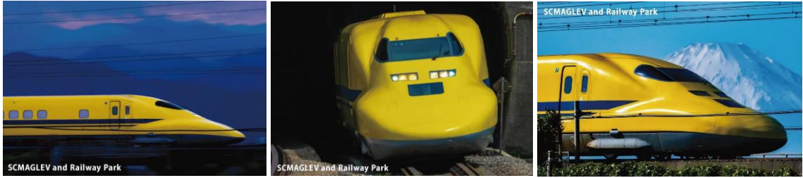
「リニア・鉄道館限定 923形ドクターイエローポストカード」(イメージ)

お仕事体験にご参加いただいた小学生のお子様には、「リニア・鉄道館限定 923形ドクターイエローポストカード」3種類1セットと、「リニア・鉄道館限定 展示車両シール (922形)」1枚をお配りいたします。なお、「付き添い入館券」でご来館された小学生のお子様にはお渡し出来ませんので予めご了承ください。