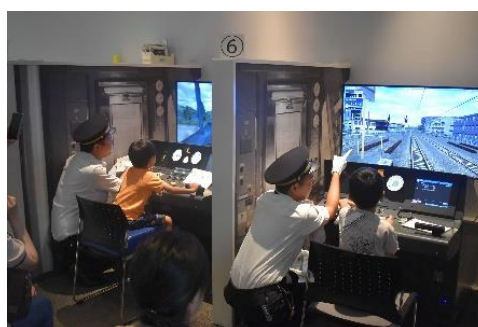
過去の同種イベントの様子