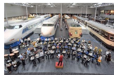
過去の同コンサートの様子