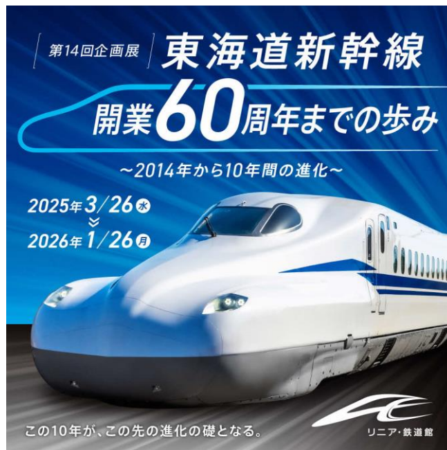
第14回企画展バナー（イメージ）

「リニア・鉄道館」のホームページでもご案内しています。 (https://museum.jr-central.co.jp/) ※内容は予告なく変更、中止することがあります。