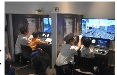
過去の同イベントの様子

10:20～、11:00～、11:40～、 12:20～、13:00～、13:40～、 14:20～、15:00～