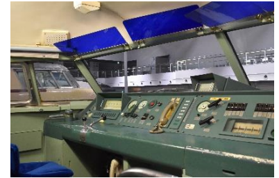
0系新幹線運転台（イメージ）