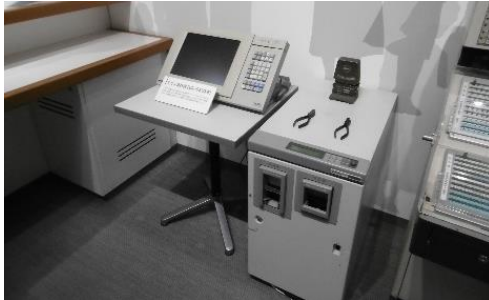
館内のマルス発券機

きっぷ販売の歴史等をご紹介した後、マルス発券機を用いたきっぷの発券、自動券売機や改札機等を使い、駅の営業業務を体験していただきます。