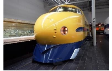
T3(922形新幹線電気軌道総合試験車)

④参加方法：総合案内にて受付（先着順：各回10組程度） ※小学生以下のお子様とその保護者が対象です。