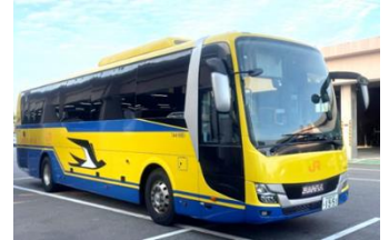
幸せの黄色いバス（イメージ）

各日10:30～、11:00～、11:30～、 12:00～、13:30～、14:00～、 14:30～、15:00～、15:30～、 16:00～、16:30～