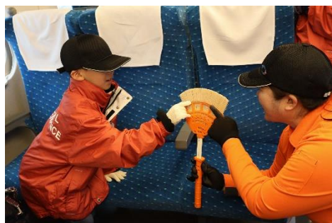
過去の同イベントの様子