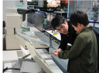
過去の同イベントの様子