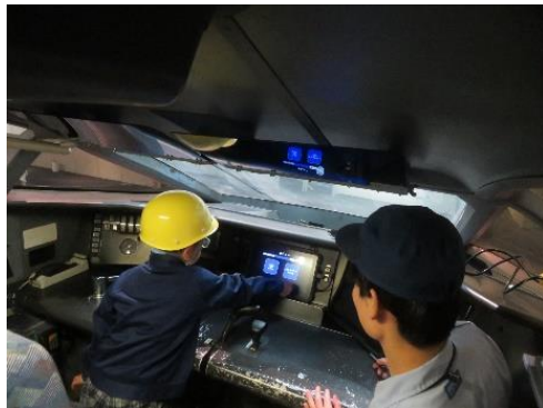
過去の同イベントの様子

新幹線車両を安全に走行させるためのメンテナンスについて勉強した後、社員と一緒に点検等を体験していただきます。