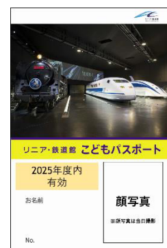
こどもパスポート（イメージ） ※サイズ：約5.4cm×約8.5cm