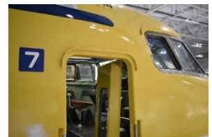
T3(922形新幹線電気軌道総合試験車) 運転台