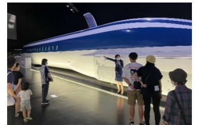
過去の同ツアーの様子