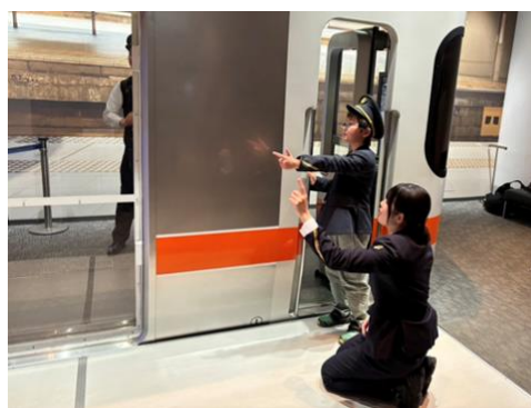
過去の同イベントの様子